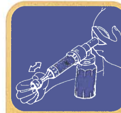
El Sacaleches Manual

sacarse la leche y dársela a su bebé. Coloque sus dedos como a una pulgada detrás del pezón formando la letra "C" con el dedo pulgar arriba y los otros dedos debajo. Haga presión hacia las costillas y luego gentilmente apriete hacia dentro y para abajo hacia el pezón, rodando y no deslizando. Mueva su mano alrededor del pecho y continúe.