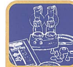
Sacaleches Eléctrico Doble

Cuando el flujo disminuya, cambie al otro pecho. Luego masajee ambos pechos otra vez y continúe sacando leche. Con un solo sacaleches manual le puede tomar entre 20 y 30 minutos.