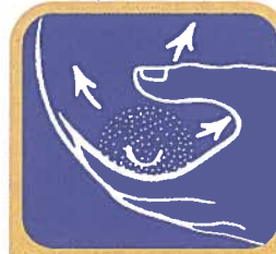
Extrayendo a Mano

Existe una variedad de maneras para sacarse la leche. El método que escoge depende de sus necesidades o sus metas.